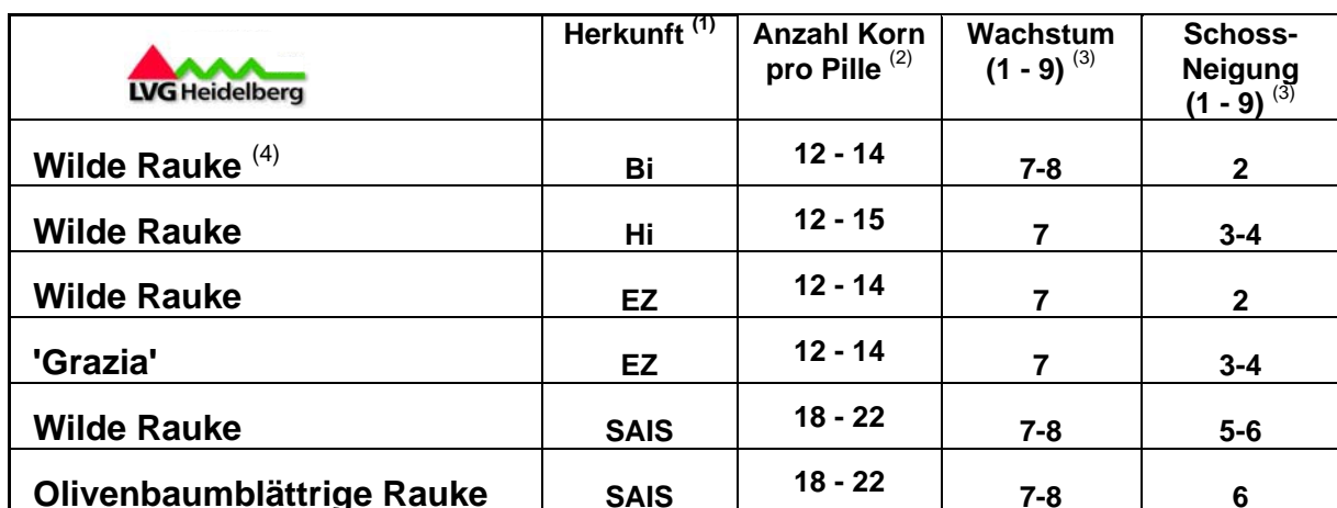
Tab. 2: Boniturdaten von Rucola im frostfreien Frühjahrsanbau